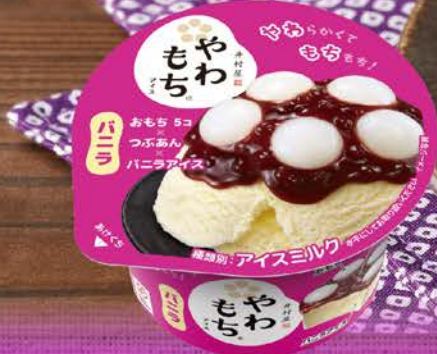
やわもちアイス バニラ