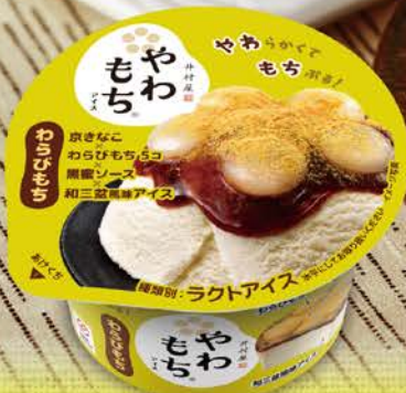
やわもちアイス わらびもち